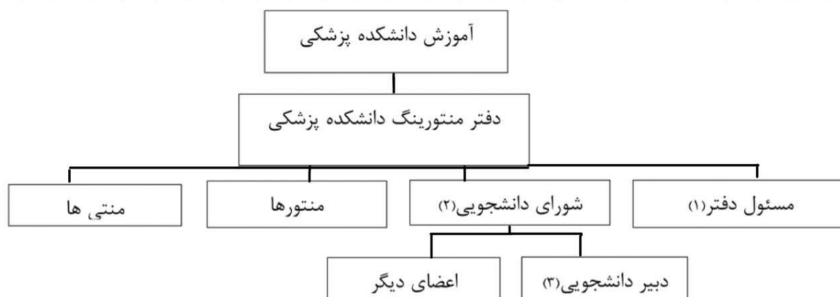
شکل ۱: چارت ساختار دفتر منتورینگ

اختیاری است و پس از ارائه‌ی توضیحاتی در مورد طرح منتورینگ فرم‌هایی در اختیار آنها جهت ثبت نام قرار می‌گیرد. در ادامه دانشجویان جدیدالورود به منتورها معرفی می‌شوند. لازم به ذکر است که در جورسازی منتور و منتی در این برنامه، منتی‌ها و منتورها هم جنس (مذکر و مونث) به هم معرفی می‌شوند. منتورها در دفتر منتورینگ که معمولاً دانشجوی پزشکی سال ۴ یا ۵ هستند، از بین افراد با شرایط مناسب تحصیلی، اجتماعی و فرهنگی انتخاب می‌شوند. منتور و منتی-ها در طول ترم به طرق مختلف (حضوری و یا مجازی) و با توالی متفاوت (با تاکید بر توالی یکبار در هفته یا هر دو هفته) با هم ارتباط برقرار می‌کنند. ارزیابی رابطه‌های منتور با منتی توسط گزارش گیرنده‌های گروه هماهنگ‌کننده دفتر منتورینگ به صورت هفتگی انجام می‌شود و سپس گزارشات در جلسات هفتگی گروه هماهنگ‌کننده مطرح می‌شود و بازخوردهای لازم به منتورها داده می‌شود. در میانه‌ی هر سال تحصیلی نیز با هدف مانیتورینگ طرح، پرسشنامه رضایت در اختیار منتی‌ها قرار می‌گیرد. شکل ۱ اجزای ساختاری دفتر منتورینگ دانشجویی دانشکده پزشکی دانشگاه علوم پزشکی تهران را نشان می‌دهد.