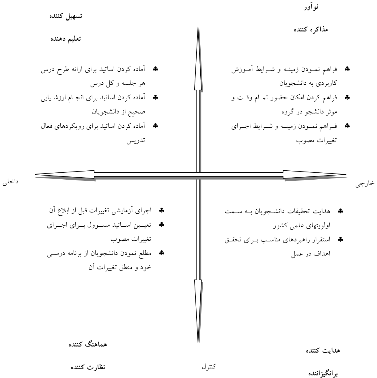
شکل ۲: تحلیل حیطه اجرای برنامه درسی بر اساس الگوی رهبری کوبین