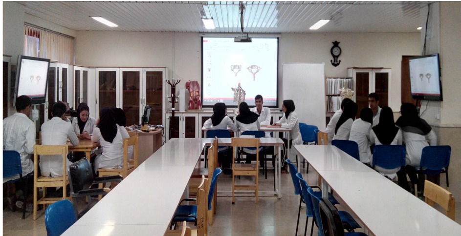
تصویر ۱: گروه بندی دانشجویان در کلاس‌های عملی در سالن مولاژ گروه آناتومی

پرسشنامه مشتمل بر ده سوال بود که حیطه‌های؛ محتوی درسی، ارتقاء یادگیری، نگرش، تعامل بین دانشجویان، مشارکت و آمادگی دانشجویان را می‌سنجید. روایی پرسشنامه با نظر خبرگان، تأیید و پایایی آن با استفاده ضریب آلفای کرونباخ به