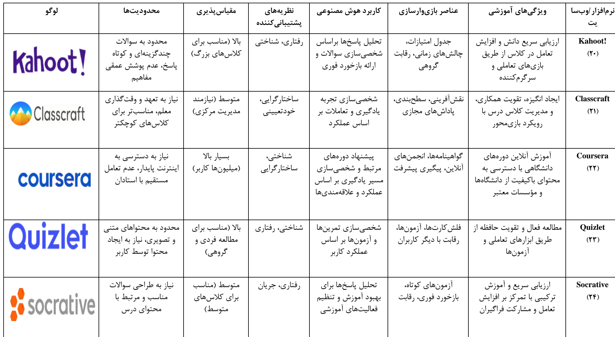
جدول شماره ۱: پلتفرم های بازی وارسازی مبتنی بر هوش مصنوعی، کاربردها، مزایا و عناصر