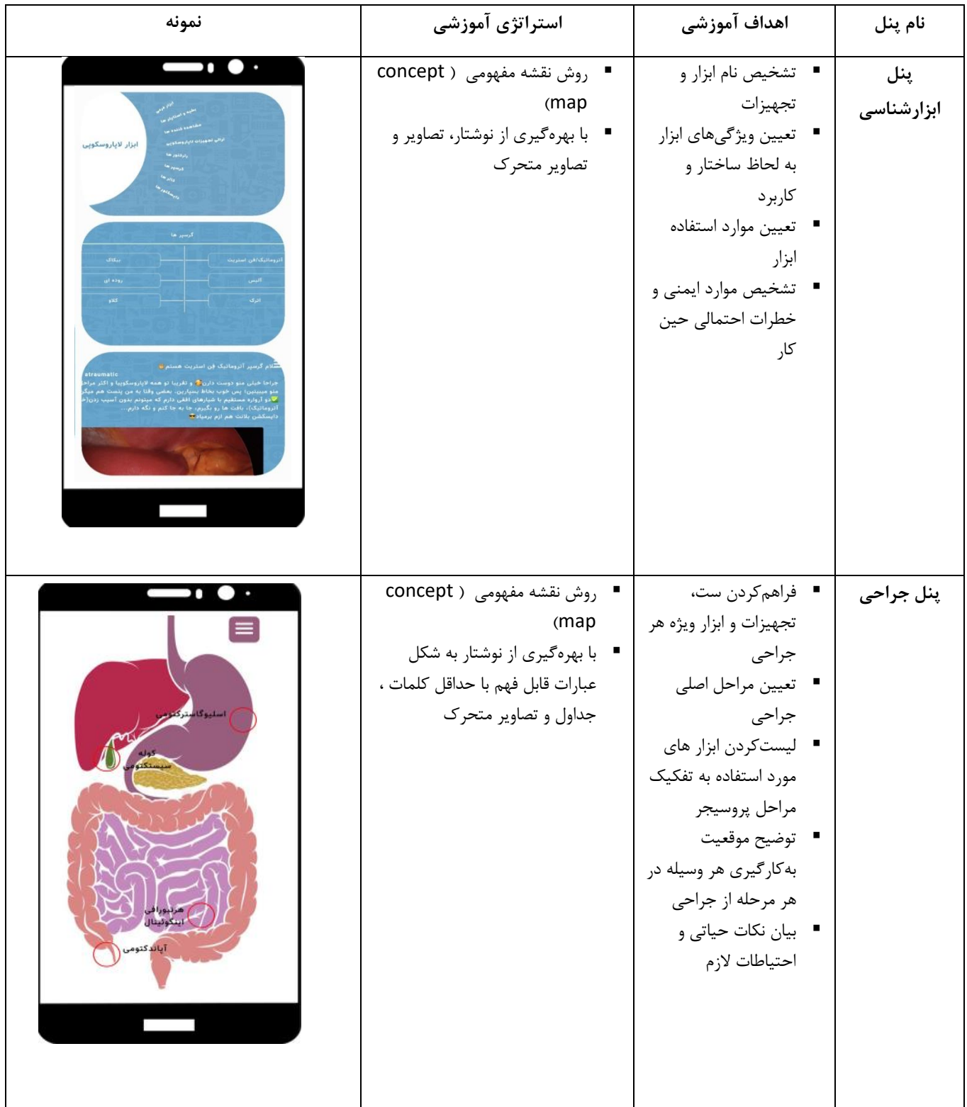
جدول ۱- ویژگی های برنامه کاربردی جراح یار لاپاراسکوپی