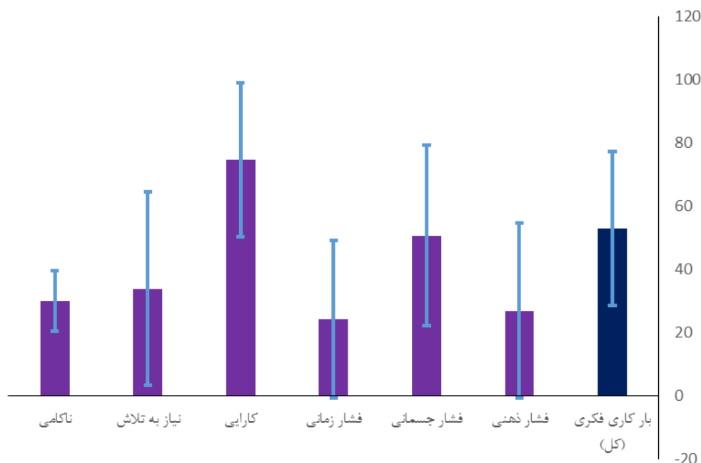
نمودار ۱. میانگین نمره بار کاری شناختی و ابعاد آن در اعضای هیئت علمی دانشکده

بعد «فشار جسمانی» با میانگین ۵۰/۶۵ و انحراف معیار ۲۸/۵۸ بود. کمترین نمره نیز متعلق به بعد «فشار زمانی ناشی از انجام وظایف شغلی» با میانگین ۲۴/۲۶ و انحراف معیار ۲۷/۷۱ بود.