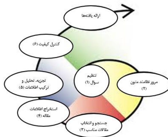
تصویر ۱: هفت مرحله روش فرا ترکیب سندلوسکی و باروسو

کلیدواژه‌های: اخلاق تدریس، اخلاق حرفه‌ای در آموزش عالی، تدریس، استاد، معلم در کلیه پایگاه‌های اطلاعاتی فارسی زبان؛ Noormag؛ Ensani؛ SID؛ Magiran؛ جستجو به عمل