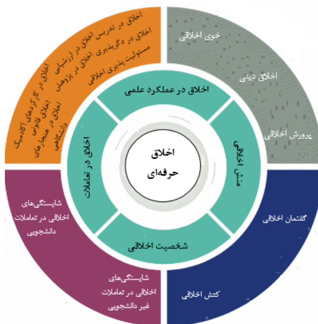
تصویر ۳. مدل مفهومی پژوهش برآمده از یافته‌ها

از مولفه‌های چهارگانه اخلاقی (اخلاق در عملکرد علمی، اخلاق در تعاملات، شخصیت اخلاقی، منش اخلاقی) بر اساس مطالعات انجام شده می‌باشد.