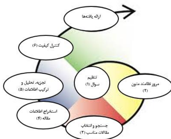
تصویر ۱: هفت مرحله روش فرا ترکیب سندلوسکی و باروسو

کلیدواژه‌های: اخلاق تدریس، اخلاق حرفه‌ای در آموزش عالی، تدریس، استاد، معلم در کلیه پایگاه‌های اطلاعاتی فارسی زبان؛ Noormag؛ Ensani؛ SID؛ Magiran؛ جستجو به عمل