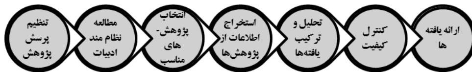
شکل شماره ۱. گام‌های مطالعه نظام مند در پژوهش حاضر

در پژوهش حاضر از روش مرور سیستماتیک از نوع تلفیقی استفاده شد. برای اجرای روش مرور سیستماتیک در پژوهش حاضر از روش هفت مرحله‌ای ساندالوسکی و باروسو (۱۹) مطابق شکل شماره ۱ استفاده شد که در ادامه توضیحاتی در خصوص هر مرحله ارائه شده است.