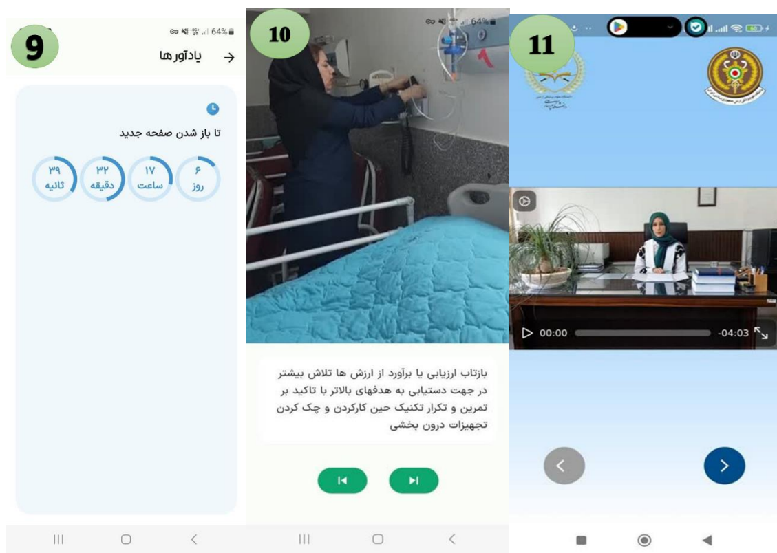
شکل ۱: ویدئوهای سخنرانی متخصص روان‌شناسی در مورد تاب‌آوری، ویدئوهای نمایش عملی تکنیک‌های تاب‌آوری، بخش یادآورها در نسخه اصلی برنامه تاب‌آوری (۱۷)

یافته‌های بخش مصاحبه‌ها بیانگر ۲ دسته عوامل برون سیستمی و درون سیستمی تأثیرگذار در افزایش سنوات تحصیلی دانشجویان بودند. عوامل برون سیستمی در سه دسته عوامل اقتصادی- اجتماعی، فردی- خانوادگی و دغدغه‌های فرادانشگاهی و عوامل درون سیستمی در چهار دسته رفتار غیرحرفه‌ای برخی استادان، مشکلات تحریر پایان‌نامه، مسأله- مند نبودن دوره‌های آموزشی و ضعف علمی دانشجویان و ضعف فرایندها و سیستم آموزشی تقسیم شدند. با طبق نتایج بدست