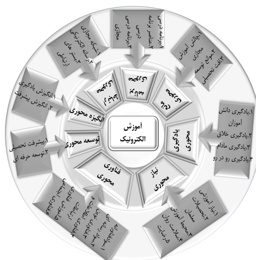
شکل ۲: الگوی مفهومی ابعاد آموزش الکترونیک

شبکه‌های مجازی، رسانه‌های الکترونیکی، بسترهای ارتباطی»، برنامه محوری «برنامه درسی، عناصر برنامه درسی، برنامه درسی مجازی»، مانع محوری «چالش‌های آموزش مجازی، موانع توسعه، افت تحصیلی»، انگیزه محوری «انگیزش یادگیری، انگیزش پیشرفت»، توسعه محوری «پیشرفت تحصیلی، توسعه حرفه‌ای» می‌باشد.