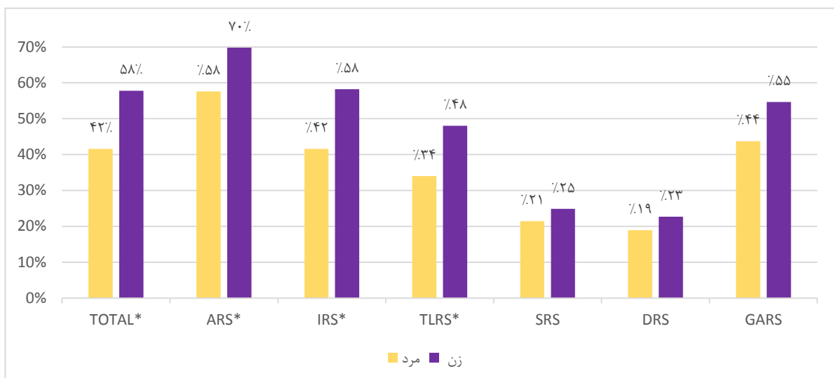
نمودار ۲: مقایسه توزیع فراوانی استرس شدید/زیاد بین دو جنس مرد و زن در کل و ابعاد مختلف (*اختلاف معنی‌داری بین دو گروه)

تفاوت در بعد روابط بین و درون‌فردی و اجتماعی در این گروه تفاوت معنی‌دار آماری نیز داشت (نمودار ۳).