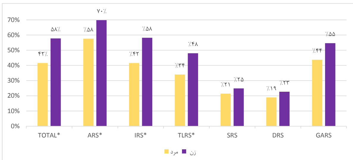
نمودار ۲: مقایسه توزیع فراوانی استرس شدید/زیاد بین دو جنس مرد و زن در کل و ابعاد مختلف (*اختلاف معنی‌داری بین دو گروه)

تفاوت در بعد روابط بین و درون‌فردی و اجتماعی در این گروه تفاوت معنی‌دار آماری نیز داشت (نمودار ۳).