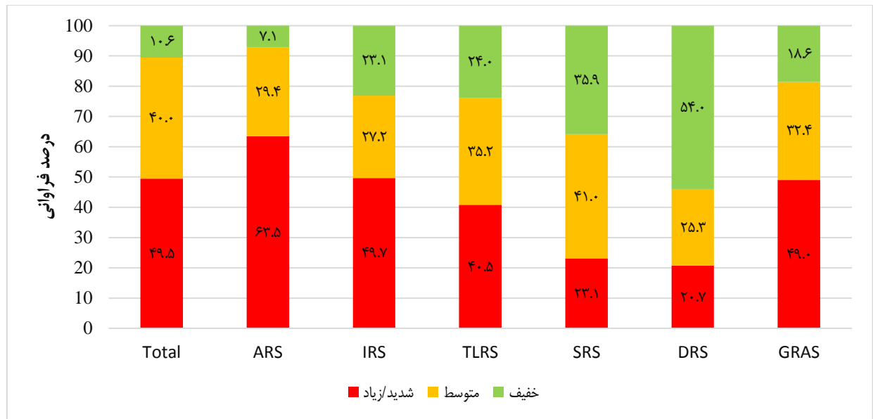
نمودار ۱: توزیع درصد فراوانی شدت کلی استرس و نیز به تفکیک ابعاد مختلف

تمامی ابعاد مورد مطالعه نسبت به آقایان میزان شدت استرس بیشتری را تجربه کرده بودند و این مهم حاکی از آن است که این گروه نیاز به توجه و حمایت‌های بیشتری نسبت به کل دانشجویان دارند (نمودار ۲).