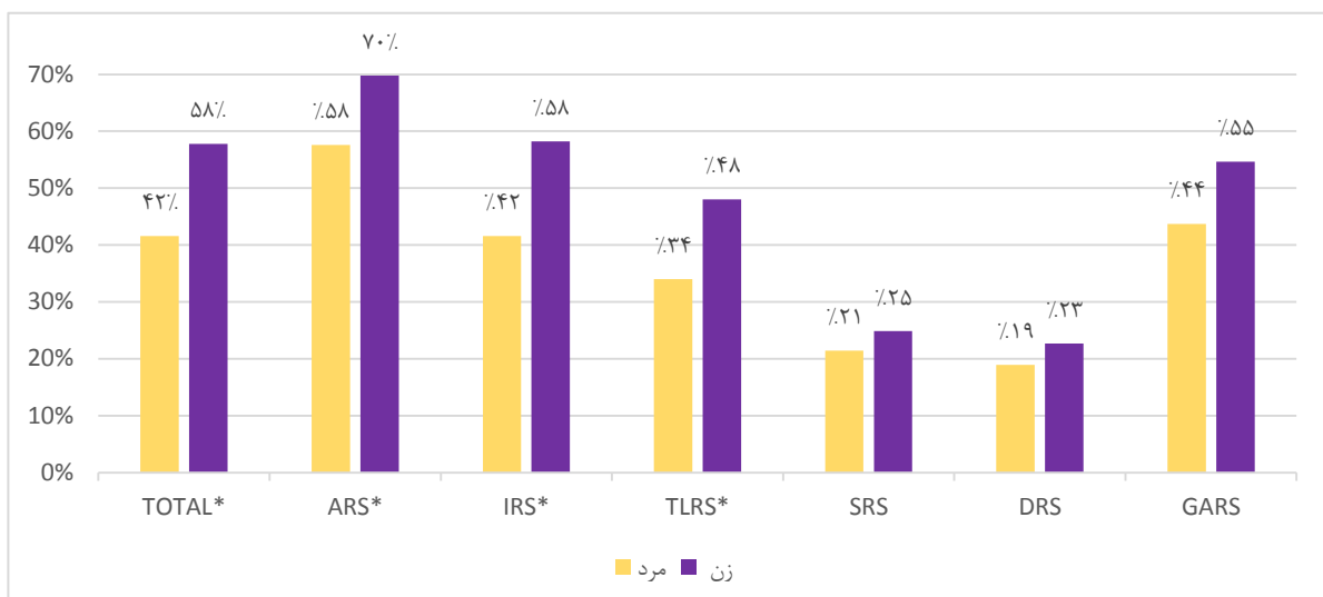
نمودار ۲: مقایسه توزیع فراوانی استرس شدید/زیاد بین دو جنس مرد و زن در کل و ابعاد مختلف (*اختلاف معنی‌داری بین دو گروه)

تفاوت در بعد روابط بین و درون‌فردی و اجتماعی در این گروه تفاوت معنی‌دار آماری نیز داشت (نمودار ۳).