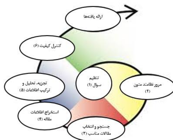
تصویر ۱: هفت مرحله روش فرا ترکیب سندلوسکی و باروسو

کلیدواژه‌های: اخلاق تدریس، اخلاق حرفه‌ای در آموزش عالی، تدریس، استاد، معلم در کلیه پایگاه‌های اطلاعاتی فارسی زبان؛ Noormag؛ Ensani؛ SID؛ Magiran؛ جستجو به عمل