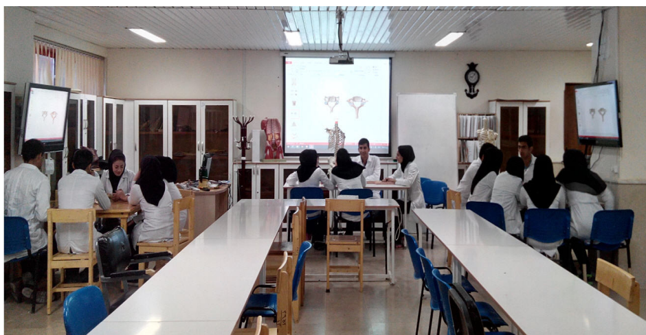
تصویر ۱: گروه بندی دانشجویان در کلاس‌های عملی در سالن مولاژ گروه آناتومی

پرسشنامه مشتمل بر ده سوال بود که حیطه‌های؛ محتوی درسی، ارتقاء یادگیری، نگرش، تعامل بین دانشجویان، مشارکت و آمادگی دانشجویان را می‌سنجید. روایی پرسشنامه با نظر خبرگان، تأیید و پایایی آن با استفاده ضریب آلفای کرونباخ به